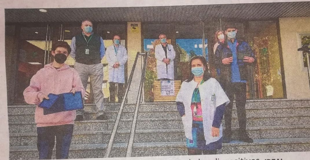
Los alumnos de Escolapios hacen entrega de los dispositivos.